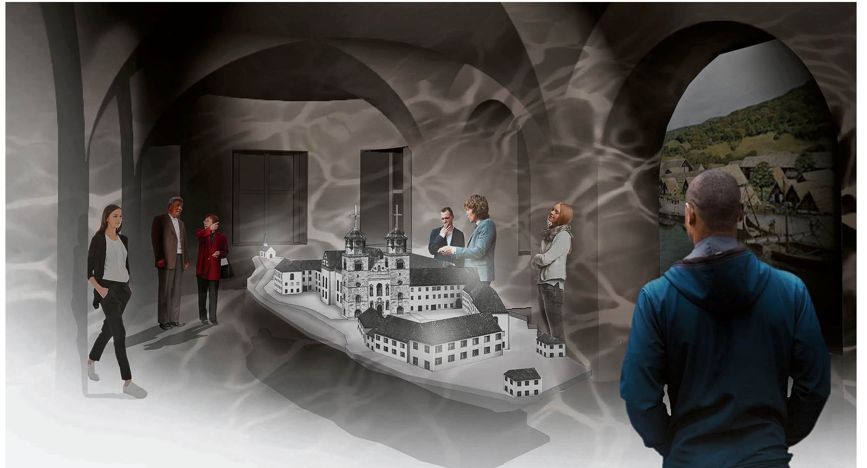
Im Eingang sollen Besucher in rund 10 Minuten etwas über die Siedlungsgeschichte erfahren.

«imRaum» nahm die Interessierten mittels Power-Point-Präsentation und zahlreichen Visualisierungen mit auf eine Reise durch das künftige Museum. Angefangen im Aussenbereich mit einem «Inselspaziergang». Zehn Stelen bieten Informationen über die Geschichte verschiedener Gebäude und durch «Gucker» gibt es Bilder aus der Psychiatriezeit sowie Rekonstruktionen zu sehen. Beispielsweise eines Raums, der im Kloster als Bibliothek diente und später in der Klinik als Nähssaal genutzt wurde.